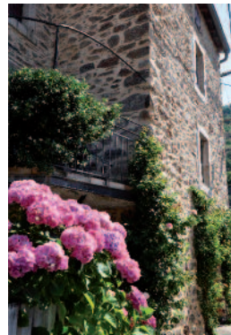
Hameau de Mauroul

2. 407 m. 31 T 490183 4825440 Effectuer un demi-tour, franchir à nouveau le ruisseau par la passerelle et se diriger à gauche, sans emprunter les escaliers, vers la cascade du Roy et la marmite de roche, dite "marmite du sanglier", d'une douzaine de mètres de haut et 6/7 m de diamètre. Revenir ensuite sur ses pas jusqu'au poteau.