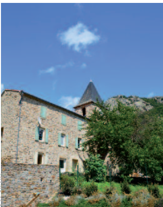
Hameau de Mauroul

Observez bien et vous reconnaîtrez son profil caractéristique et ses dents acérées ! Voici la légende du dragon : "Il y a de cela bien longtemps, vivaient en ces lieux toutes sortes d'Elfes, fées et lutins. La vie y était harmonieuse, la nature apportait la nourriture du corps et de l'esprit. Mais, juste à l'entrée du hameau, lorsque l'on arrive par l'antique chemin, se trouvait, tapi dans une grotte, un dragon maléfique qui anéantissait l'imprudent. Les habitants de tout l'Espinouse, effrayés, demandèrent aux Dieux de les aider et promirent en échange, d'être bons et hospitaliers. Instantanément, le dragon fut transformé en roche et un ruisseau vint cascader à ses côtés."